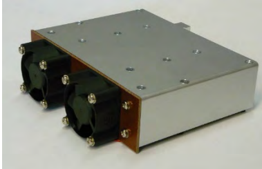
2 kW -omvormer