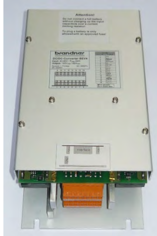
4 kW -omvormer