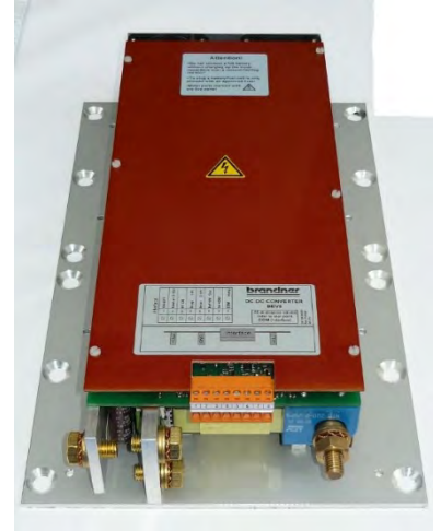
8 kW -omvormer