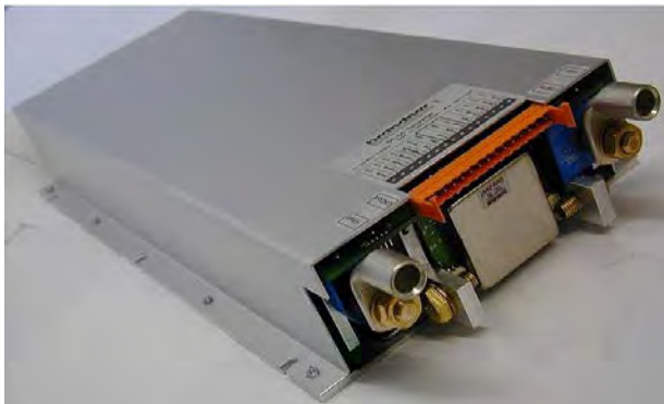
Max. 30 kW – omvormer