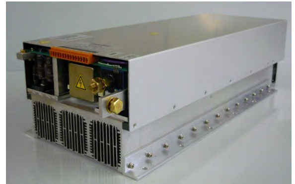
16 kW omvormer